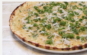
釜揚げしらすとねぎと カラスミのピッツア 1800円 (税込1944円)