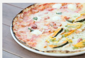
カスタマイズピッツア (ハーフ&ハーフ) 2100円 (税込2268円)