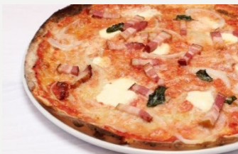
ゼファーピッツア 1800円 (税込1944円)