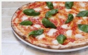
水牛モッツアレラの マルゲリータ 1800円 (税込1944円)