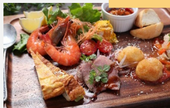
前菜盛り合わせ (2人前) 1700円 (税込1836円) (お料理内容は季節によって変わります)