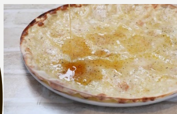
クアトロフォルマッジ 1800円 (税込1944円)